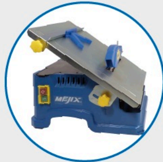
● Table inclinable 0° - 45°. 0 to 45° tilting table.