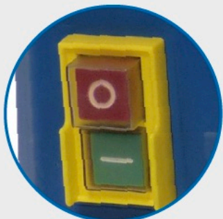
● Interrupteur à manque de tension. NVR Switch.