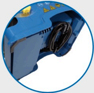
● Range câble sous la machine. Cable storage under the machine.